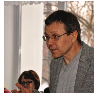
Начало на стр.2